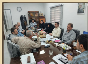
برگزاری نشست یک‌روزه مدیران معاونین و کارشناسان حوزه معاونت دانشجویی و فرهنگی دانشگاه صنعت نفت