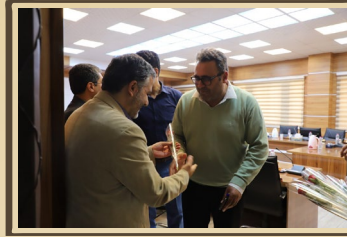
تجلیل رئیس دانشگاه به مناسبت روز معلم از اساتید دانشگاه صنعت نفت