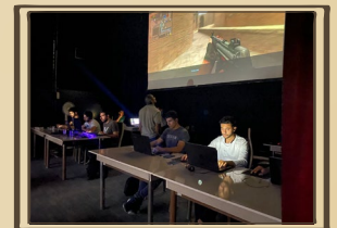
برگزاری فینال مسابقات CSS بسیج دانشجویی دانشکده نفت آبادان