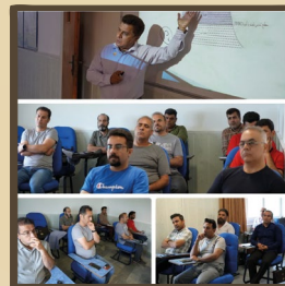
برگزاری دوره آموزشی جمع‌آوری و انتقال مایعات گازی و کار در ارتفاع در دانشکده نفت محمودآباد