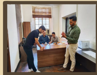
برگزاری انتخابات انجمن‌های علمی نفت مکانیک و شیمی دانشکده نفت آبادان