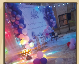
برگزاری ویژه برنامه دورهمی دخترانه ۲ به مناسبت ولادت باسعادت حضرت معصومه (سلام‌الله‌علیها) و روز دختر؛ واحد خواهران بسیج دانشجویی دانشکده نفت آبادان