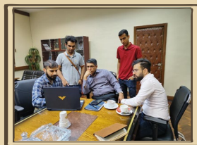
دومین مسابقه هوش مصنوعی و علم داده دانشکده نفت آبادان با محوریت ارزیابی ریسک جریان‌های فرآیندی