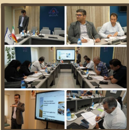
برگزاری دوره بین‌المللی NEBOSH IOGC در دانشکده نفت محمودآباد