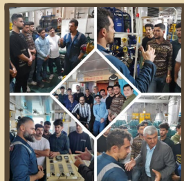
بازدید دانشجویان رشته مهندسی ماشین‌آلات دریایی دانشکده نفت محمودآباد از بندر فریدون‌کنار