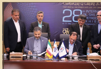
امضای توافق‌نامه‌های مشاوره نظارت بر پروژه‌ها و مدیریت دانش فی‌مابین دانشگاه صنعت نفت و شرکت پالایش نفت آبادان

در بیست و هشتمین نمایشگاه بین‌المللی نفت، گاز، پالایش و پتروشیمی تهران، دانشگاه صنعت نفت با بورس انرژی، پتروشیمی فن آوران، پتروشیمی پارس، شرکت پالایش نفت آبادان و تسکو تفاهم‌نامه همکاری امضا نمود. اولین تفاهم‌نامه همکاری دانشگاه صنعت نفت با بورس انرژی با موضوع "ارائه خدمات مشاوره پژوهشی و اقتصادی به منظور توسعه بازارها و ابزارهای مالی بورس انرژی و حمایت از انجام مطالعات کاربردی" به امضا رسید. در ادامه ۲ تفاهم‌نامه همکاری مشترک با پتروشیمی فن آوران با موضوعات "استفاده بهینه از پتانسیل موجود ظرفیت‌ها، توانایی‌های علمی و اجرایی" و "دستیابی و ثبت دانش فنی تبدیل متانول به خوراک دام و طیور" منعقد گردید. سپس تفاهم‌نامه‌های مشترک دیگری با پتروشیمی پارس با موضوع "همکاری