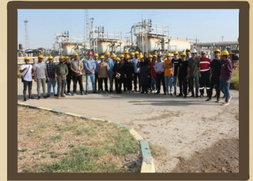
برگزاری اردوی راهیان پیشرفت به عنوان کارگاه عملی تولید صیانتی از یک میدان هیدروکربوری با برقراری شرایط پایداری تولید در زنجیره ارزش بسج دانشجویی دانشکده نفت آبادان