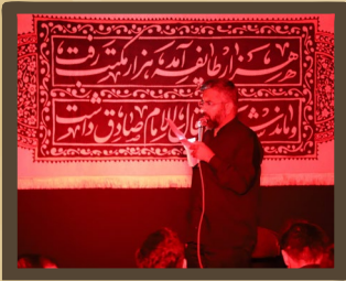
برگزاری مراسم عزاداری شهادت امام جعفر صادق (علیه السلام) در دانشکده‌های نفت آبادان و اهواز