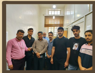
برگزاری انتخابات انجمن‌های علمی مهندسی ایمنی و بازرسی فنی و SPE