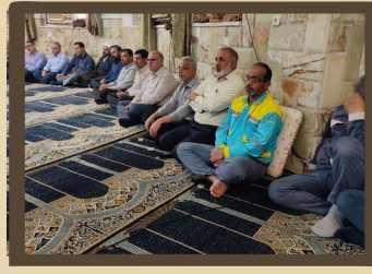
برگزاری مراسم ترحیم شهادت آیت الله رئیسی رئیس جمهور محبوب کشورمان و هیئت همراه در دانشکده اهواز