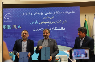
امضای تفاهم‌نامه همکاری علمی، پژوهشی و فناوری فی‌مابین دانشگاه صنعت نفت و شرکت پتروشیمی پارس