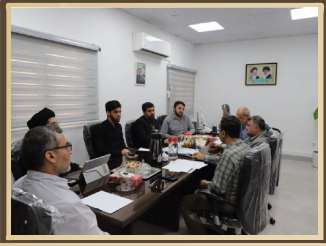
برگزاری جلسه کمیته ناظر بر نشریات دانشگاه صنعت نفت