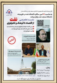
نشست از نفت تا فرهنگ و تکنولوژی به مناسبت ۱۶مین سالروز اکتشاف نفت