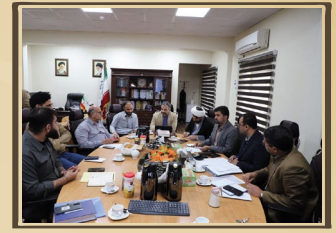
برگزاری جلسه شورای فرهنگی دانشگاه صنعت نفت