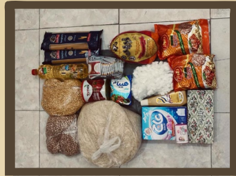
تهیه و پخش ارزاق خشک - خیریه دانشجویی انصار