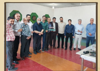
برگزاری مسابقات دارت جام‌ماه مبارک رمضان در دانشکده نفت آبادان