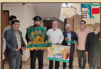
حضور خدام معزز استان قدس رضوی به همراه پرچم متبرک حرم امام رضا (علیه‌السلام) در دانشکده نفت آبادان