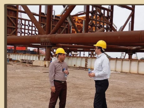
بازدید رئیس دانشکده نفت شهید تندگویان آبادان و مدیر گروه مهندسی مکانیک دانشکده نفت آبادان به همراه دانشجویان کارشناسی ارشد از شرکت مهندسی و ساخت تاسیسات دریایی ایران (یلارد خرمشهر)