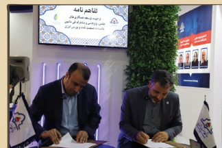
امضای تفاهم‌نامه در جهت توسعه همکاری‌های علمی، پژوهشی و مشترک مابین دانشگاه صنعت نفت و بورس انرژی

مشترک طرفین در زمینه پژوهشی، تحقیقات کاربردی در راستای رفع نیازها، تنگناها، چالش‌های فنی عملیاتی و زیست محیطی فناوری آزمایشگاهی "۲ تفاهم‌نامه با شرکت پالایش نفت آبادان با موضوعات "اجرای پالایش نیمه صنعتی گوگرد زدایی کاتالیستی از مازات با استفاده از فناوری پلاسماهای غیر حرارتی" و "انجام خدمات مشاوره نظارت و مدیریت دانش پروژه‌های صنعتی و پژوهشی" به امضا طرفین رسید. در سومین روز نمایشگاه، دانشگاه صنعت نفت تفاهم‌نامه همکاری با شرکت تسکو انرژی سپهر کیش (تسکو) با موضوع "تامین، توسعه و ارتقای سطح علمی و تخصصی سرمایه‌های انسانی مورد نیاز صنایع نفت و گاز و پتروشیمی" و قرارداد پژوهشی با موضوع "طراحی و بهینه‌سازی استفاده از فوم در فرآیند آوری مصنوعی با گاز" با شرکت نفت و گاز اروند امضا نمود.